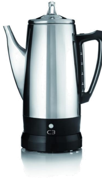
C3 Basic Perkolator 12 Tassen, 1,8l