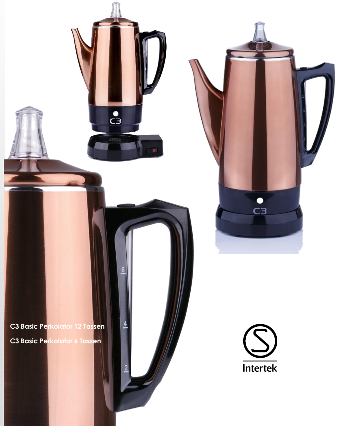
C3 Basic Perkolator 12 Tassen

Der C3 Basic Perkolator ist das in Schweden am häufigsten verkaufte Modell. Er entspricht der EU-Umweltrichtlinie und verfügt über eine automatische Abschaltfunktion 40 Minuten nach Beginn des Brühvorgangs. Das Aufbrühen einer vollen Kanne dauert ungefähr 10 Minuten. Anschließend wird der Kaffee in der Kanne warmgehalten, bis die Stromversorgung nach ca. 30 Minuten unterbrochen wird. Das kabellose Design vereinfacht die Handhabung. Der Basic Perkolator ist als Modell für 12 Tassen oder 6 Tassen erhältlich, jeweils mit einem glänzenden Edelstahl- oder kupferfarbenen Finish.