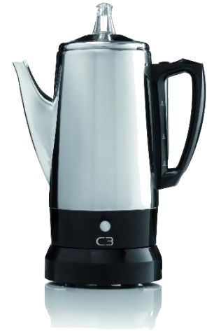
C3 Basic Perkolator 6 Tassen, 0,9l