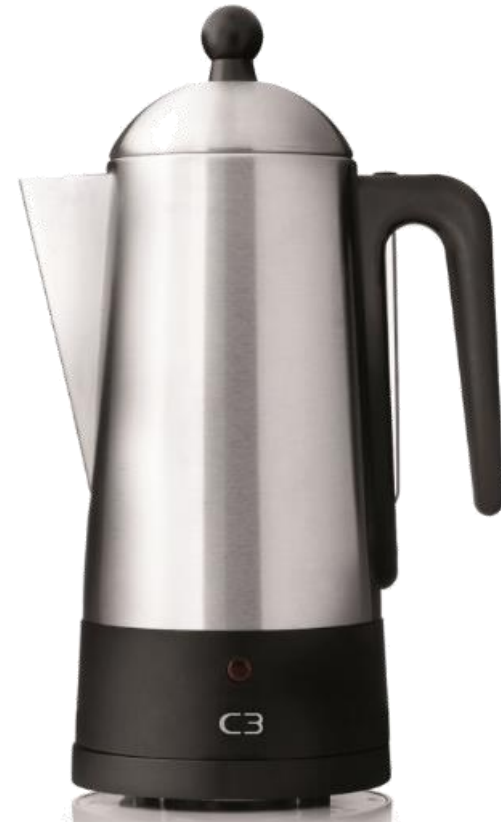
C3 Design Perkolator. Design; Björn Sahlén

Sie geben einfach gemahlene Kaffee in den Behälter im oberen Teil der Kanne. Das Wasser wird erhitzt und steigt nach oben. Dort verteilt es sich über dem gemahlene Kaffee. Dieser Vorgang wird so lange wiederholt, bis die Wassertemperatur den Siedepunkt erreicht. Der Brühvorgang wird daraufhin gestoppt und die Lampe an der Kanne leuchtet auf. Ihr Kaffee ist fertig und wird bei ca. 96 °C warmgehalten.